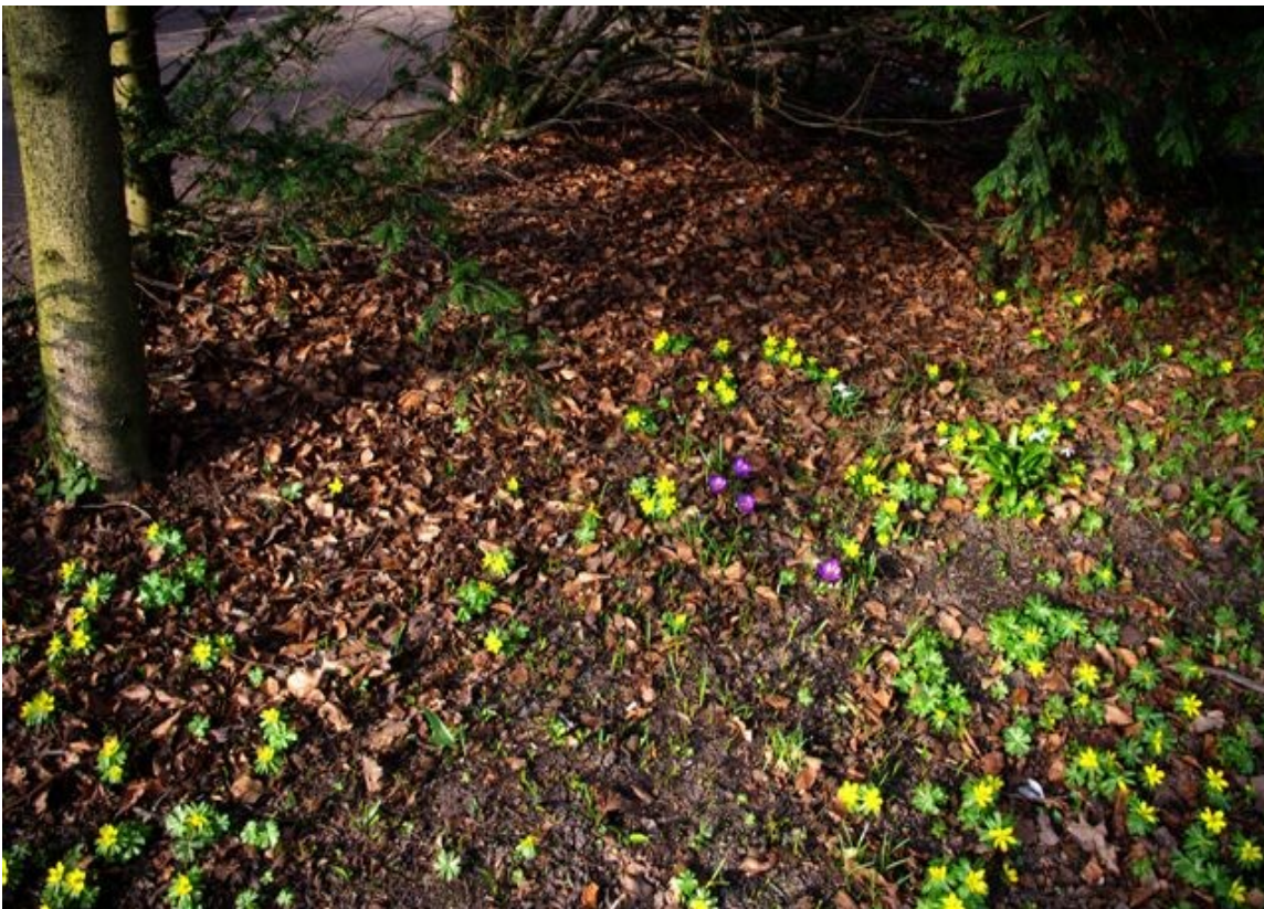
Foto 3: Vår på väg i Stadsparken i Lund.