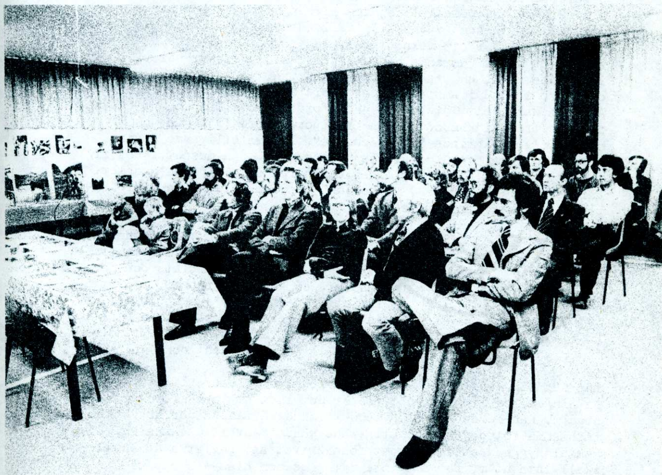
Publikbild från 1975 års Difostämman i Tranås.