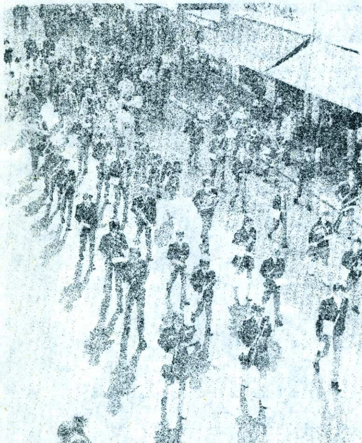
Ett litet men sälsynt demonstrationståg i ungdomsorkestrernas följe. Det är fotoentusiaster från hela Sverige som under två dagar snäller ut bilder och håller stämman i Bollnäs.

kvaliteten på de svart/vita kollektionerna är tekniskt sett högklassiga.